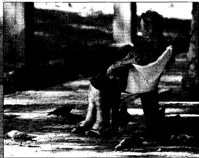
Immagini di donne nel caldo della Capitale o impegnate manager ma sofferenti secondo il Libro bianco