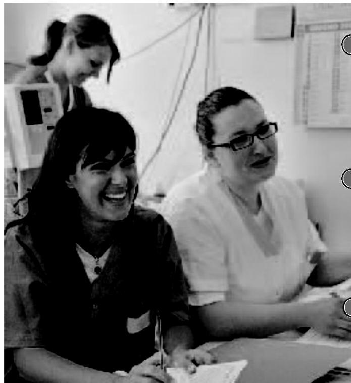
Primato «rosa». Operatrici in un reparto degli Ospedali Riuniti di Ancona